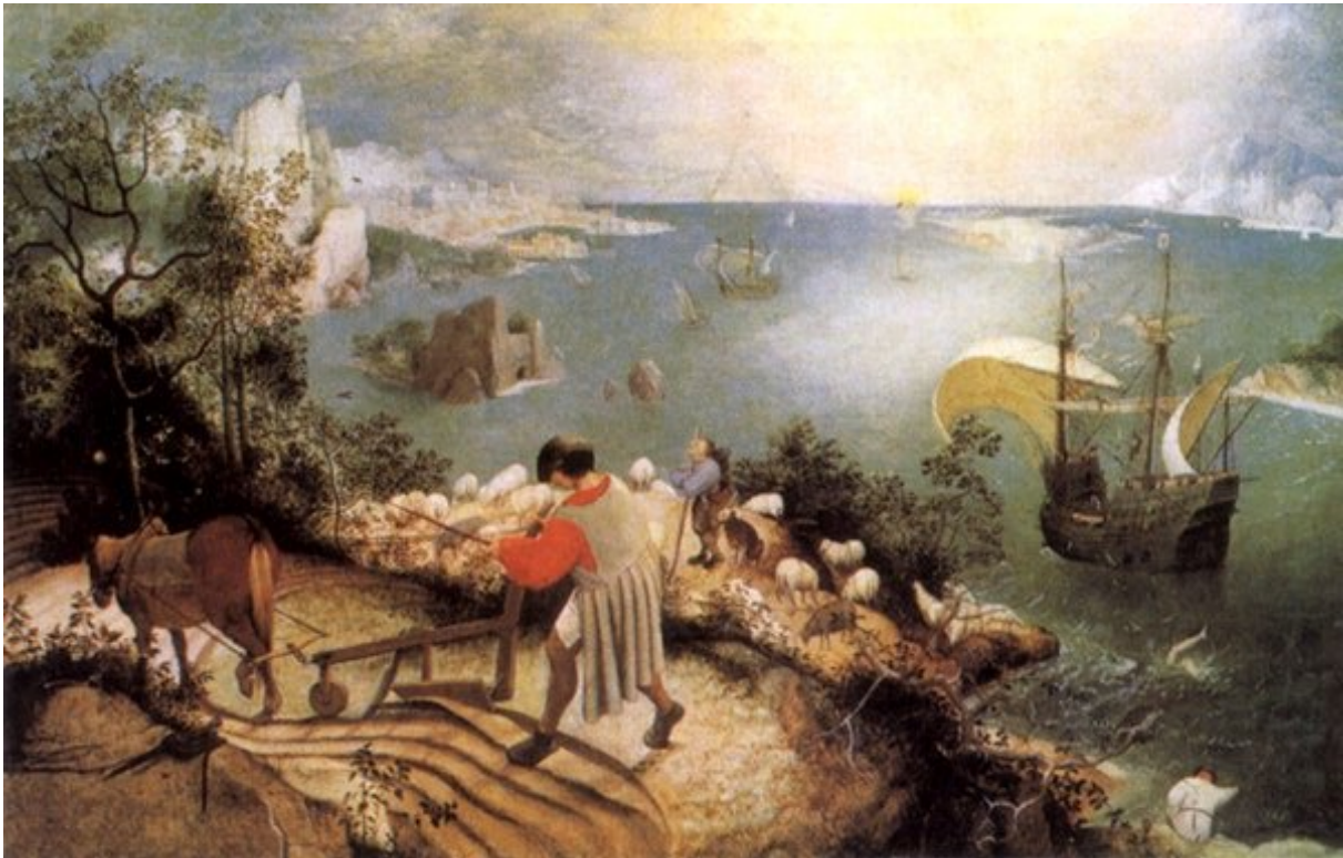
Pieter Bruegel, Paesaggio con la caduta di Icaro (1558)

In un angolo del dipinto, un paio di gambe spariscono in mare con uno spruzzo tanto lieve che a stento viene notato dal visitatore del museo, e ancor meno dai personaggi della composizione. Ogni figura del quadro è interamente concentrata su se stessa; assorbiti dalle proprie occupazioni, dalla natura che viene lavorata e sfruttata.