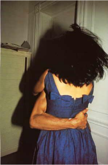
The Hug (New York 1980)

In conclusione, la serie The Ballad è una riflessione sull'amore vissuto nella quotidianità, come è sottolineato anche dall'organizzazione delle fotografie in uno slide show (di 50 minuti) accompagnato da una colonna sonora, fatta di brani musicali di generi diversi (musica classica, pop e rock), come se fosse un film.