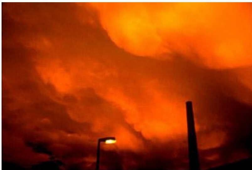
The sky on the twilight of Philippine's suicide. Winterthur. Switzerland. By Nan Goldin, 1997.

Però, nel complesso, le fotografie di Nan acquisiscono toni più ottimistici: lo dimostra la qualità diversa dei ritratti della scena alternativa di New York, Bangkok, Manila e Tokyo oppure la rappresentazione dell'amore che si esprime anche attraverso i ritratti a Siobhan, sua partner e amica per alcuni anni. C'è un modo più gentile di vedere le relazioni sentimentali e affettive che, ora, diventano luogo di complicità e di tranquilla vita familiare e sono libere dall'antagonismo alla base di The Ballad of Sexual Dependency